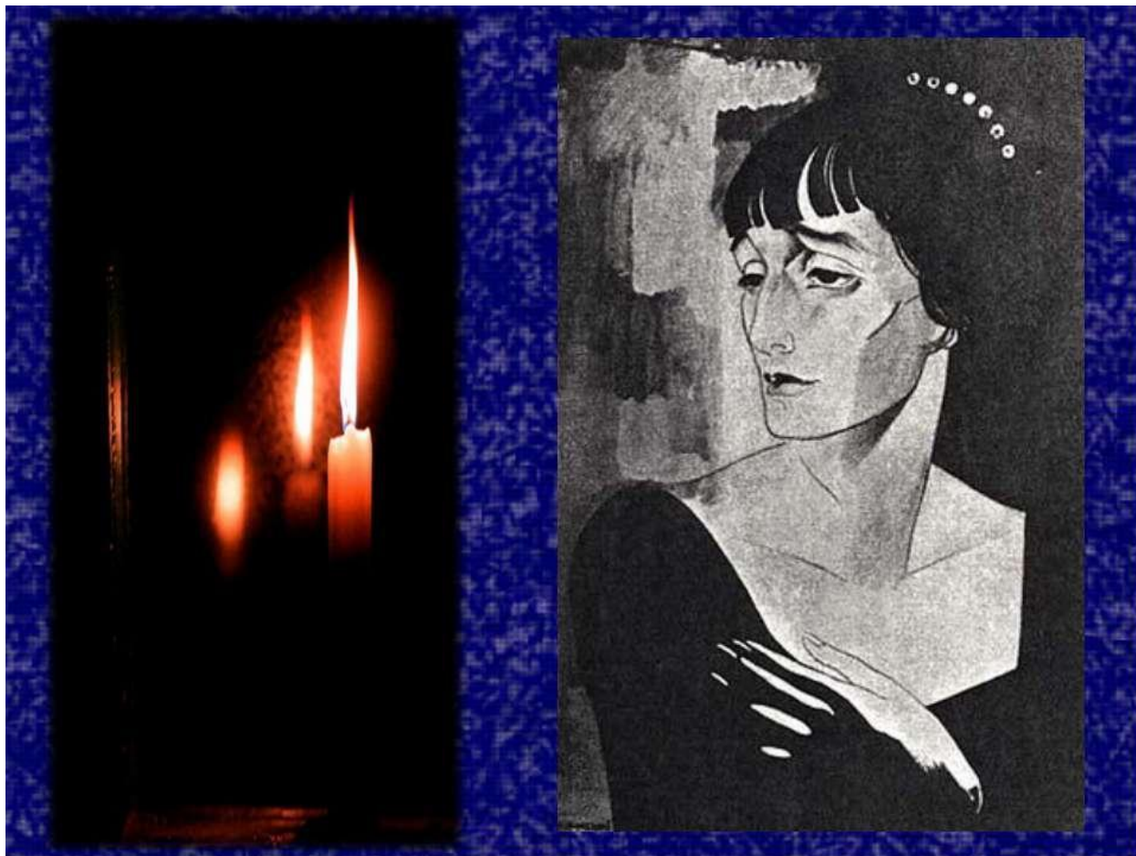
А.Ахматова поэма «Реквием»