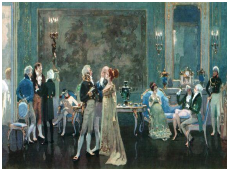
Л.Н.Толстой. Роман «Война и мир».