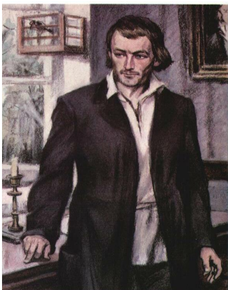
И.С.Тургенев. Роман «Отцы и дети».