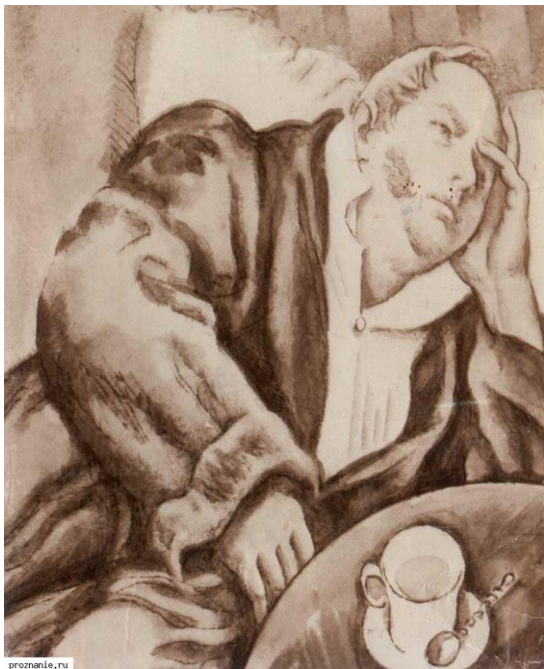
И.А.Гончаров. Роман «Обломов».