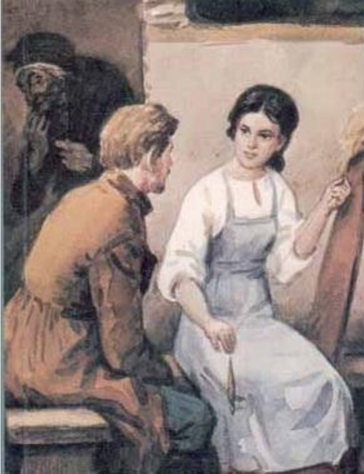
А.И.Куприн Повесть «Олеся»