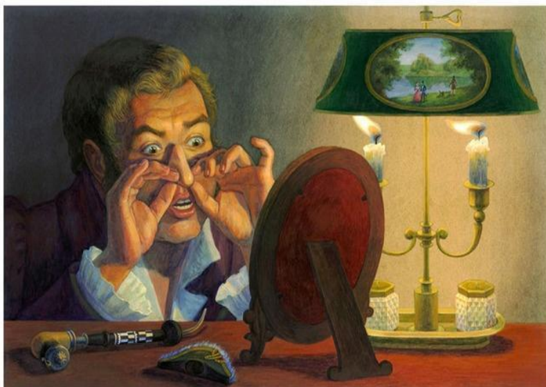
Н.В.Гоголь Повесть «Нос»