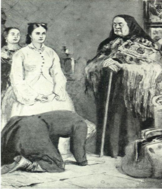
А.Н. Островский. Пьеса «Гроза».