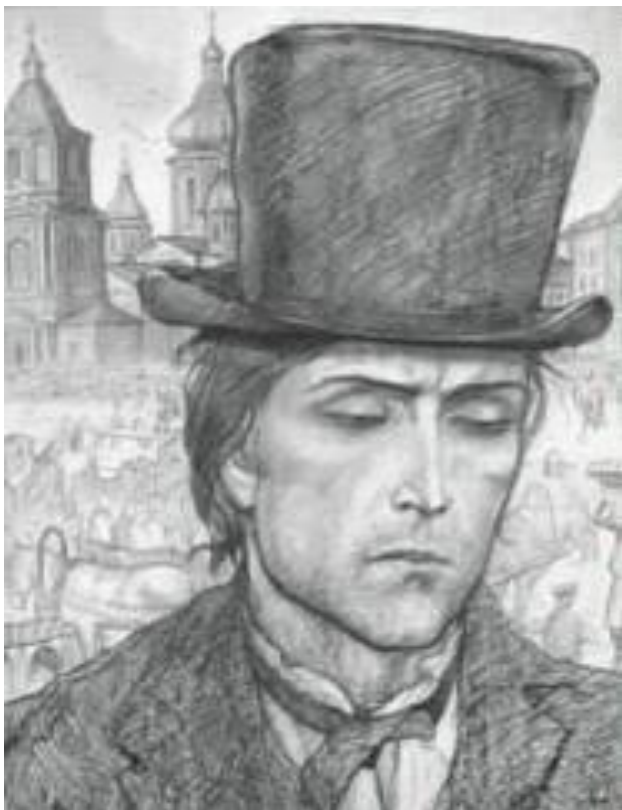
Ф.М.Достоевский. Роман «Преступление и наказание».