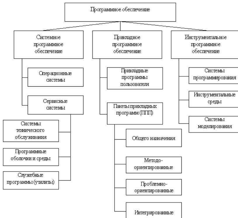
Рис. 3.1. Категории программного обеспечения

Составьте в текстовом редакторе и прокомментируйте схему